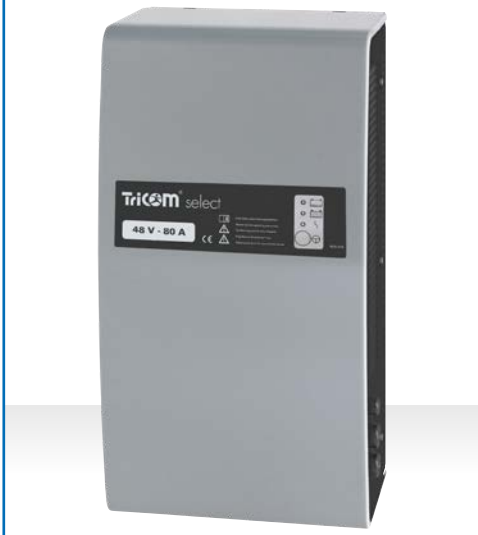
Ladegerät TriCOM select, Gehäusetyp WT 20