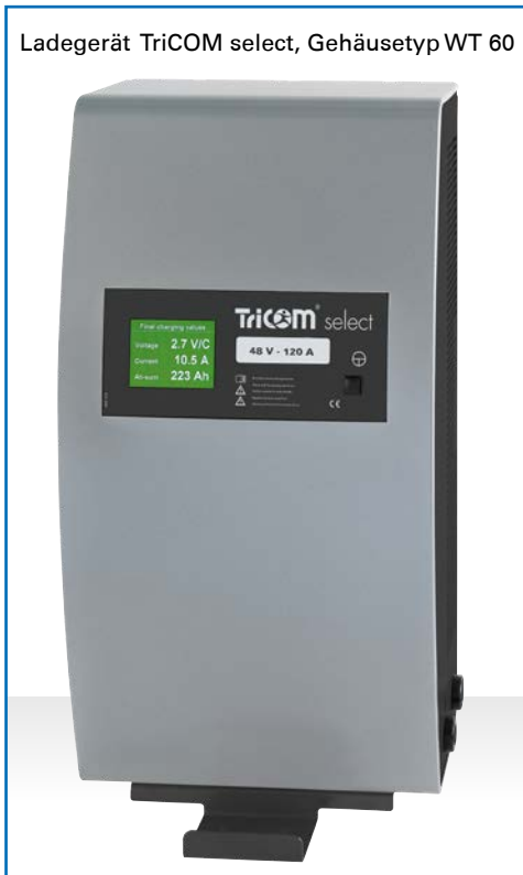
Ladegerät TriCOM select, Gehäuse Typ WT 20